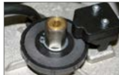
Механическая двухдисковая муфта