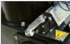
Механический концевой выключатель с рычагом