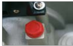
Версии SATURN OIL с масляной смазкой редуктора для максимальной продолжительности рабочего цикла