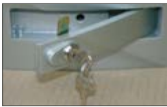
Устройство разблокировки с алюминиевым рычагом и замком