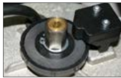
Механическая двухдисковая муфта в масляной ванне