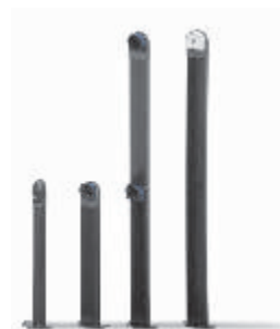
□ COS/COF COB