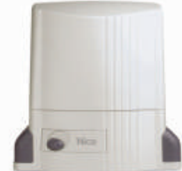
◇ THOR THOR-Q

Для откатных ворот с весом створки до 1500 и 2200 кг соответственно. Для частного и промышленного применения