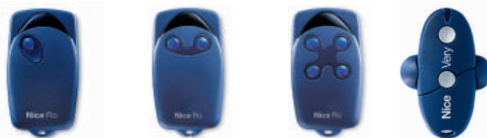
□ FLO1 □ FLO2 □ FLO4 □ VE

Позволяют осуществлять управление 1, 2 или 4-мя устройствами автоматики