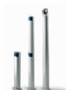
□ MOCS/ MOCF MOCF2