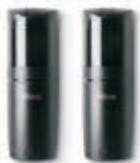
□ F210 Ft210

Широкий ряд фотоэлементов: с поворотной оптикой, с технологией BlueBUS, а также беспроводные фотоэлементы