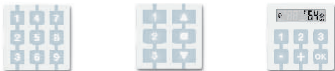
□ WM009C □ WM003C1G □ WM240C

Позволяют осуществлять одиночное и групповое управление (от 3 до 240 устройств автоматики)