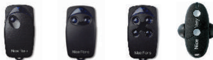
□ FLO1R-S □ FLO2R-S □ FLO4R-S □ VR

Позволяют осуществлять управление 1, 2 или 4-мя устройствами автоматики. Повышенный уровень безопасности