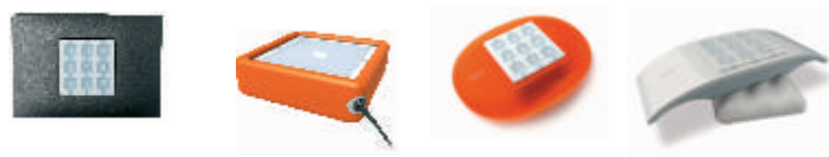
□ Opla □ Go □ Stone □ Ondo

Модули ДУ могут размещаться в различных корпусах